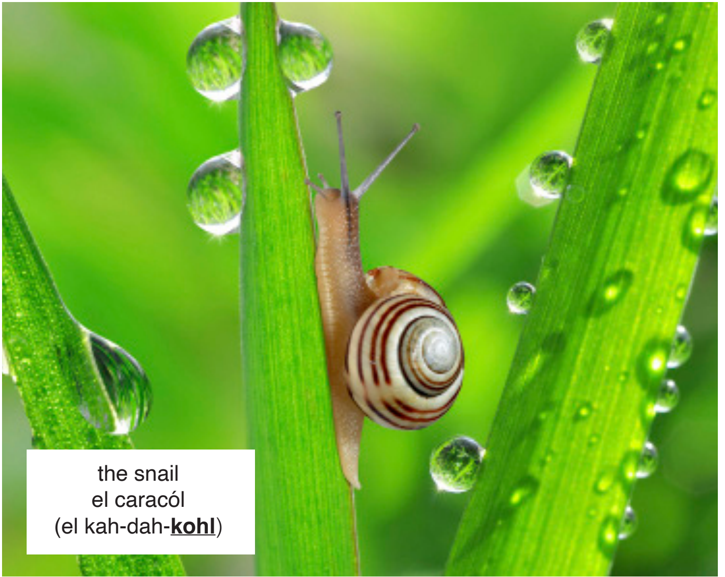
the snail el caracól (el kah-dah- kohl )