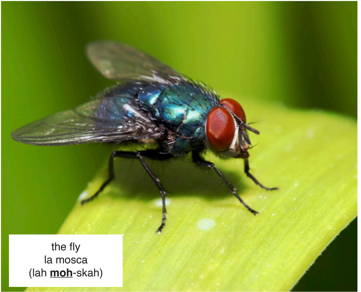
the fly la mosca (lah moh -skah)