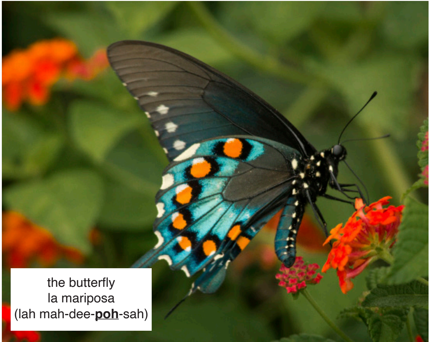
the butterfly la mariposa (lah mah-dee- poh -sah)